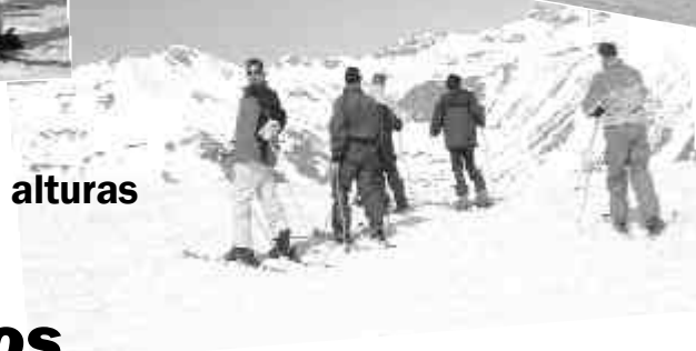
nos atrevemos con las alturas