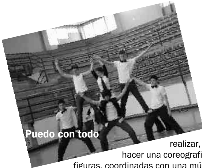
Puedo con todo