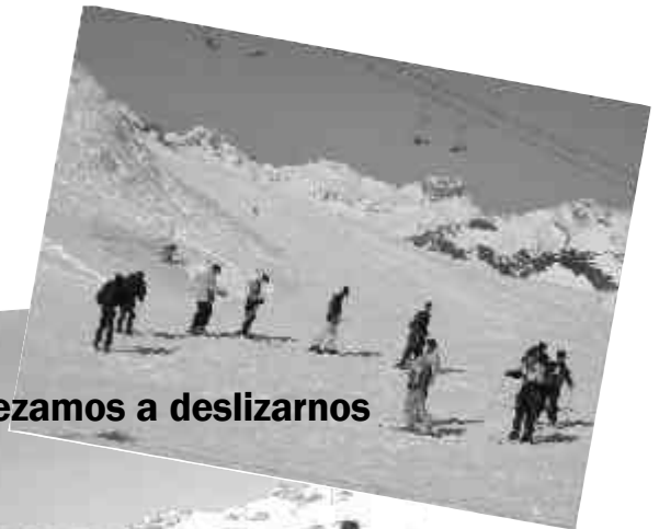
empezamos a deslizarnos