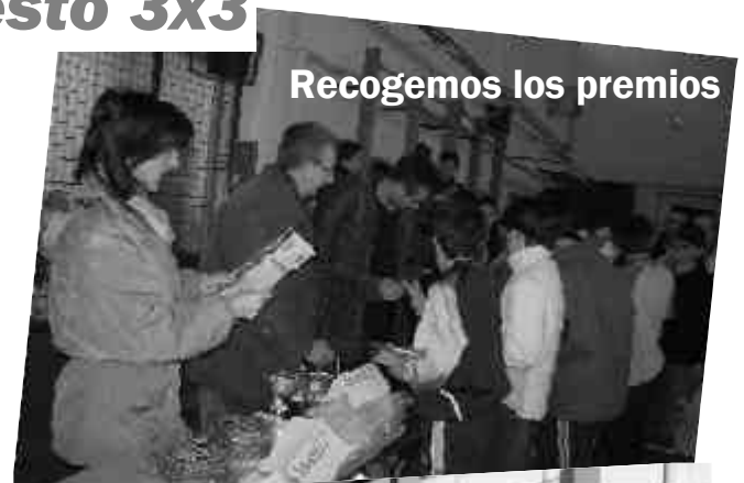
Recogemos los premios