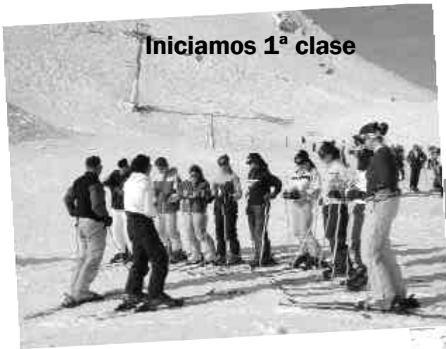
Iniciamos 1ª clase

Nos desplazamos hasta Jaca para aprender y disfrutar de la montaña sobre las tablas. Conocemos el valor de la convivencia y ayuda en grupo.