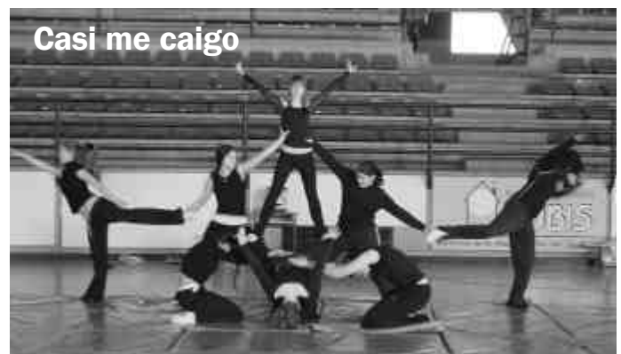
Casi me caigo